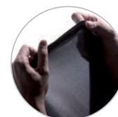
Detalle punto transpirable