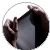
Detalle punto transpirable