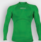
20 Verde Kelly